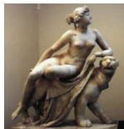
Ariadna di Johann Heinrich Dannecker (XIX secolo)